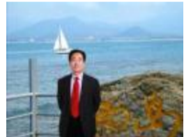
清明雨 张林山(山东)

二零零八夏季,北京奥运会记忆还复映眼前;十四年后北京冰墩儿向世界招手,各路健儿再会在京张。“一起向未来”旋律在全球传颂,“更快、更高、更强”活剧在冰雪银幕上演。