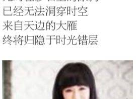
秋之恋 艾米(内蒙古)